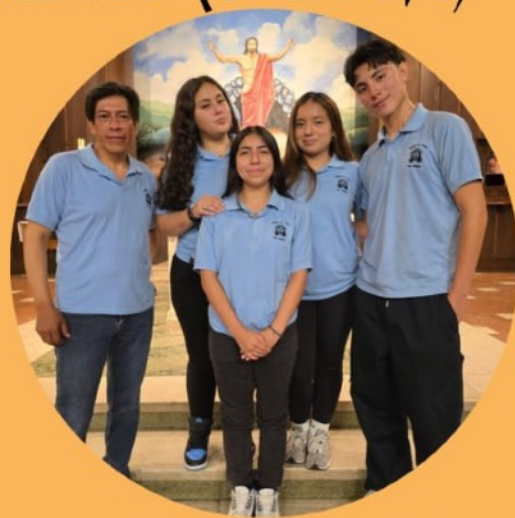
Unidos en Cristo

Santa Misa a las 7:00pm. Luego al auditorio de la escuela 438 Grove St, Brooklyn, NY 11237